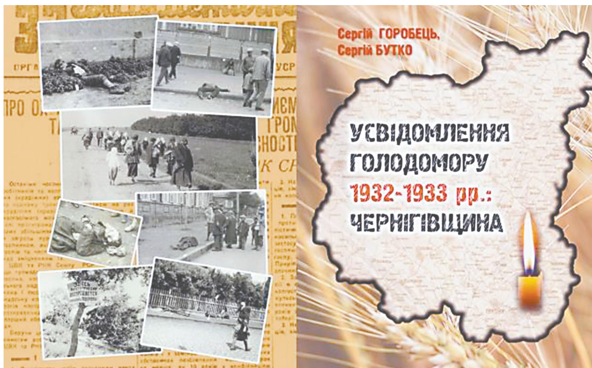
Сторінку підготував Олег Дешура

людей. Загалом головна мета книги – аналіз тих подій, історичних фактів. Тому й назва відповідна «Усвідомлення Голодомору».