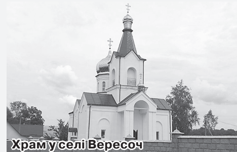
Храм у селі Вересоч