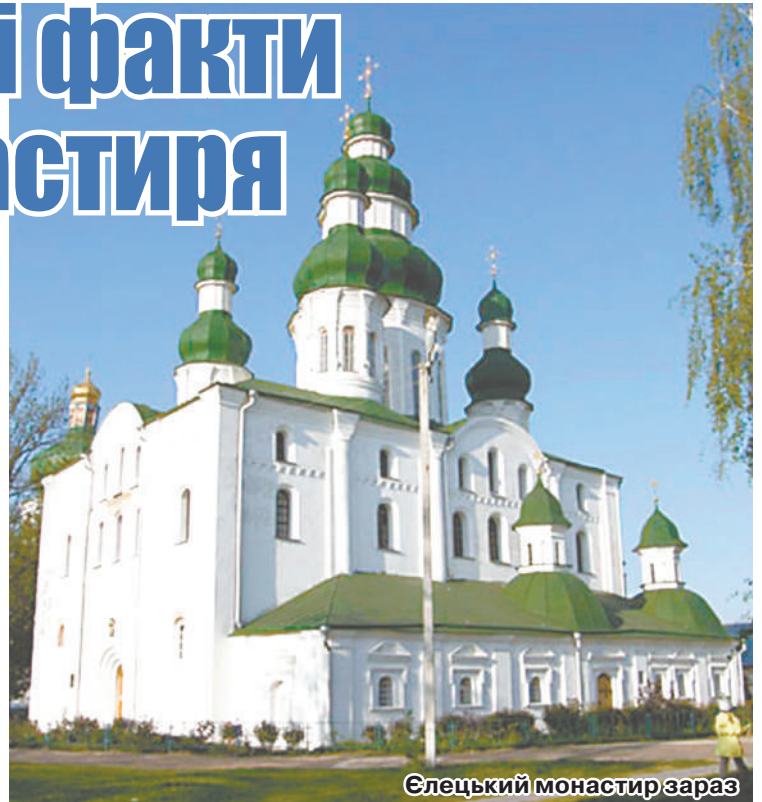
Єлецький монастир зараз