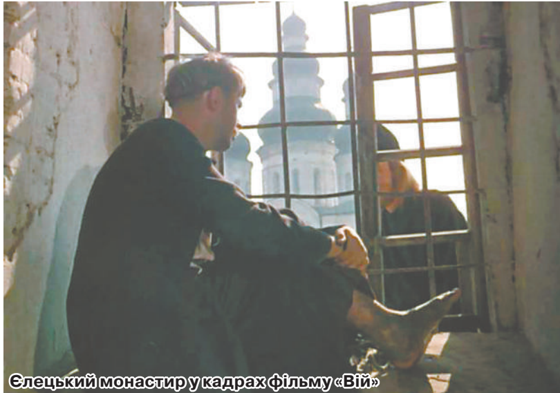
Єлецький монастир у кадрах фільму «Вій»