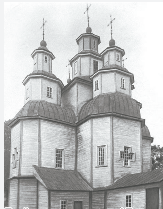
Троїцька церква в селі Пакуль