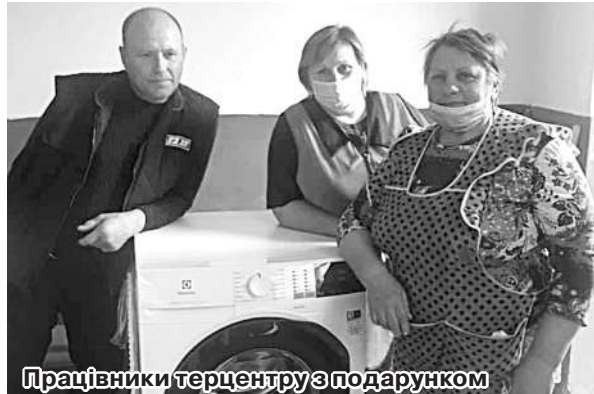
Працівники терцентру з подарунком

«Ми дякуємо нашому депутату за допомогу. Пральна машина велика, можна за один раз випрати більше одягу чи білизни, тож, звісно, це значно полегшить нашу роботу та покращить умови підопічних», – кажуть працівниці центру.