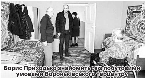
Борис Приходько знайомиться з побутовими умовами Вороньківського терцентру

У лютому цього року під час робочого візиту до Бобровицького району народний депутат України Борис Приходько відвідав у селі Вороньки відділення територіального центру соціального обслуговування, передав їм пелети для опалення, а також ознайомився з побутовими проблемами.