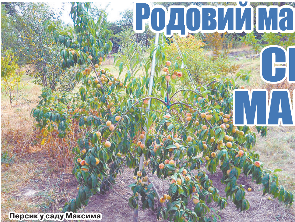
Персик у саду Максима