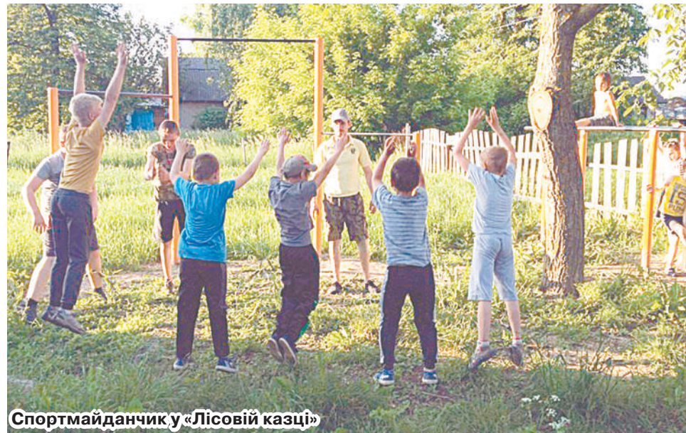
Спортмайданчик у «Лісовій казці»

«Купили будинок із ділянкою – розширилися. У 2009 році тато взявся саджати ліс. І пізніше цю справу вже я продовжив по-своєму, як я це бачу. Зараз більше займаюся деревами. Завдяки інтернету є можливість купити якусь екзотичну рослину, навчитися доглядати за