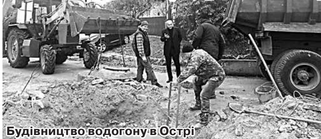
Будівництво водогону в Острі