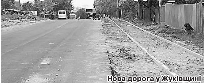
Нова дорога у Жуківщині

Посприяти в покращенні якості питної води – саме про це найчастіше просять народного депутата України Бориса Приходька жителі 210-го округу (м. Прилуки, Прилуцький, Бобровицький, Козелецький р-ни). Так, відповідне звернення до депутата надійшло від жителів міста Остер із проханням посприяти в капітальному ремонті водопровідної мережі на вісім вулиць. Борис Приходько відреагував на звернення виборців й об'єкт вже розпочали капітально ремонтувати. Під час робочої поїздки до Козелецького району нардеп ознайомився з перебігом будівельних робіт і поспілкувався з будівельниками.