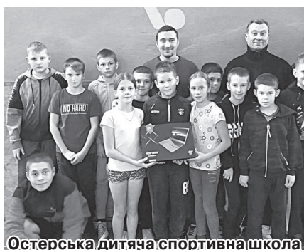
Остерська дитяча спортивна школа