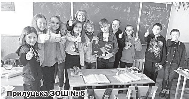
Прилуцька ЗОШ №6

У межах власної соціальної програми «Доступна освіта», започаткованої у 210-му виборчому окрузі, народний депутат України Борис Приходько передав у заклади освіти свого округу нові ноутбуки.