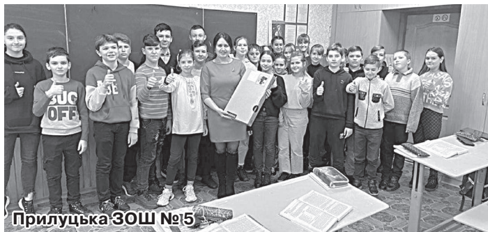
Прилуцька ЗОШ №5