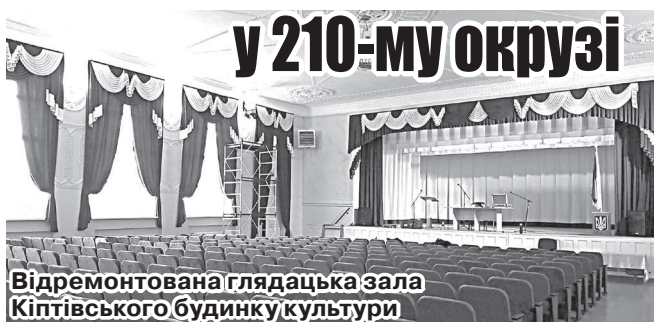
Відремонтована глядацька зала Кіптівського будинку культури