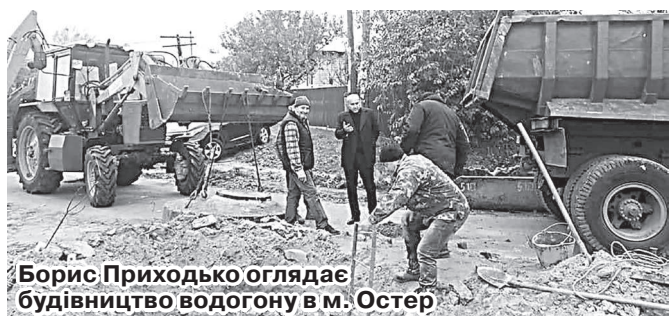
Борис Приходько оглядає будівництво водогону в м. Остер

Цьогоріч у липні держава розділила між народними депутатами близько 1,7 млрд грн на реалізацію понад 1150 проєктів у громадах усієї України. За сприяння депутата Бориса ПРИХОДЬКА, який у Верховній Раді представляє 210-й виборчий округ (м. Прилуки, Прилуцький, Бобровицький і Козелецький райони), громади округу отримали 10 млн грн. Ці кошти спрямували на побудову та реконструкцію дев'ятьох важливих інфраструктурних об'єктів.