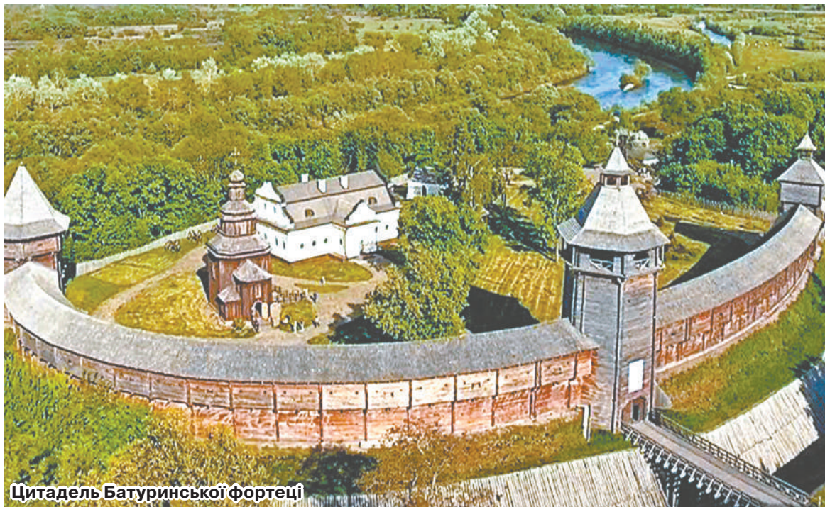
Цитадель Батуринської фортеці

ще не був головою, щоб не сказали «ось тут приїхав і накрив», я собі побудував бізнес. Звів базу відпочинку, ресторан відкрив і на цьому заробляю гроші. Тому бюджетні кошти мене не цікавлять взагалі. Перші два роки на посаді в мене зарплата була 2500 гривень і я її собі не підвищував. Заплата зросла вже тоді, коли в бюджеті з'явилися гроші, і громада трішки встала на ноги. А взагалі вважаю, що я прийшов не по зарплату, а для втілення ідей. Тому усім кажу: якщо ідете кудись, то кажіть чесно: вам потрібні гроші чи вам треба щось змінити. Якщо гроші, то ви не туди прийшли. Якщо щось змінити, заходьте, будемо говорити.